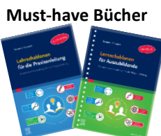
Lehrschablonen (Azubi) & Lehrschablonen (PA)