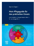
Mein Pflegeguide Elsevier Verlag