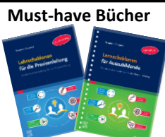
Lernschablonen (Azubi) & Lehrschablonen (PA)