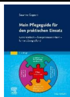
Mein Pflegeguide Elsevier Verlag