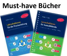
Lernschablonen (Azubi) & Lehrschablonen (PA)