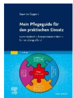
Mein Pflegeguide Elsevier Verlag